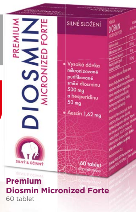
Premium Diosmin Micronized Forte 60 tablet