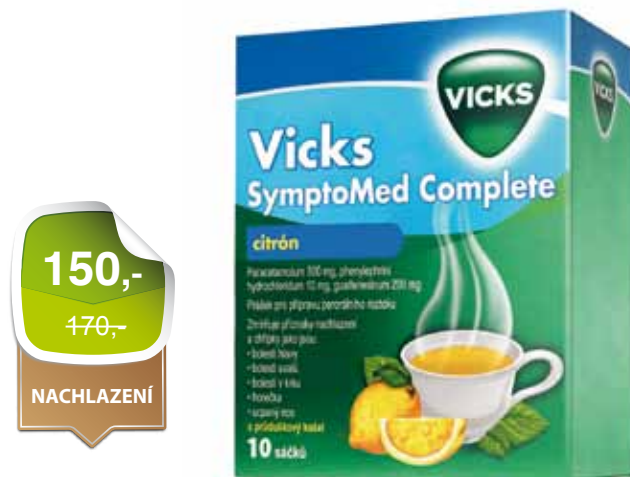
Lék k vnitřnímu užití. Přípravek mohou používat dospělí a děti od 12 let.

Zmírňuje příznaky nachlazení a chřipky jako jsou bolesti hlavy, bolest v krku, bolest kloubů, horečka, ucpaný nos.