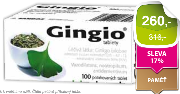
Lék k vnitřnímu užití. Čtěte pečlivě příbalový leták.